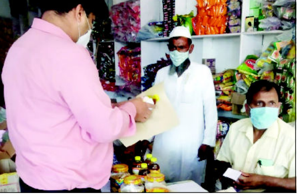
ہاپوڈ (ایس این بی) تہوار کا سیزن آتے ہی ملاوٹ خوراک کے خلاف خلیج جیسٹریٹ کی ہدایت پر چھاپہ مار کارروائی کی گئی۔

دکانوں سے سرسوں تیل اور دیگر سامان کے نمونے جانچ کے لئے بھیجے