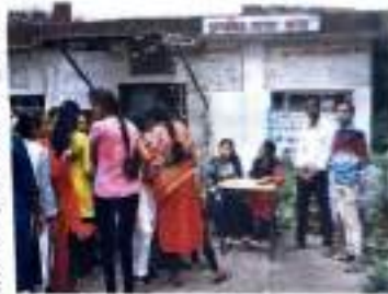
अपराधी, विशेषतः प्रचलित गैर कानूनी कार्यों की जांच

सूक्ष्म वैद्यकीय भेद्यतापी ३ २० दिवसीय स्वस्थता विधि। जलमय जलमय के जलमय उपचार के ३० दिवसीय विधि। ३२२ जलमय के स्वस्थता विधि। जलमय के २-३ दिवसीय