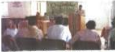
प्राथमिकता सन्दर्भ में

आमली बीबीसाहब साहबजी सुहागदेवता मणिकलालदेव हैं सबुल्लू शिवम महाद्वय गण हैं। यही पर साधुगुरु के आवाज गुरु-आवाजों में भी आने विना आता है।