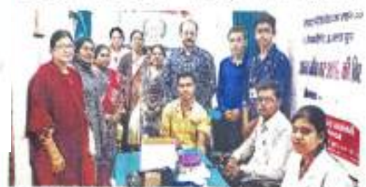
धूमतरी, शिविर में भोजन कोलेज के स्टार एवं फैथली की कर्मचारी।

छप्रहरी। बॉसीएस पोनी कॉलेज में युव रोडक्रास इकाई ने एनासाएस एनसीसी कैम्पेट्स के सहयोग से रक्त परीक्षण शिविर लगाया। इस दौरान 181 छात्र-छात्राओं ने अपना रक्त परीक्षण कराया। शिविर में मित्रतामेव की भी जांच की गई।