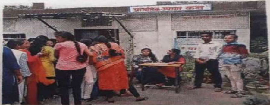
धमतरी. शिविर में स्वास्थ्य जांच कराती कालेज की छात्राएं।

यूथ रेडक्रॉस सोसायटी द्वारा दो दिवसीय स्वास्थ्य शिविर का आयोजन कालेज के प्राथमिक उपचार केन्द्र में किया गया। शिविर में 327 छात्राओं का स्वास्थ्य परीक्षण किया गया। जिसमें 2-3 प्रतिशत