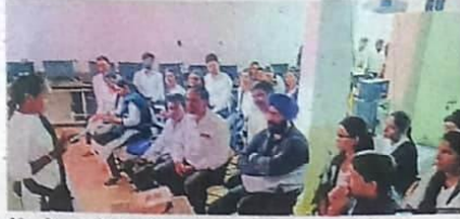
प्रोफेसरों व छात्रों को संविधान दिवस के संबंध में जानकारी दी गई।

जिला विधिक प्राधिकरण के निर्देशानुसार सुबह 11.00 बजे से आईटी भवन के ऊपर हॉल में भारत के राष्ट्रपति के नेतृत्व में संसद भवन के सेंट्रल हॉल में हुए संविधान दिवस समारोह का प्रोजेक्टर के माध्यम से सीधा प्रसारण किया गया। विधि विभाग के छात्र-छात्राओं एवं महाविद्यालय के अन्य छात्र-छात्राओं को दिखाया गया।