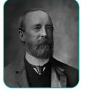
A. O. ஹியூம்