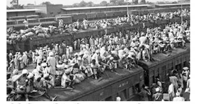
பிரிவினையின் விளைவாக அகதிகள் வருகை