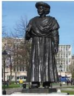
இராஜா ராம்மோகன் ராய்